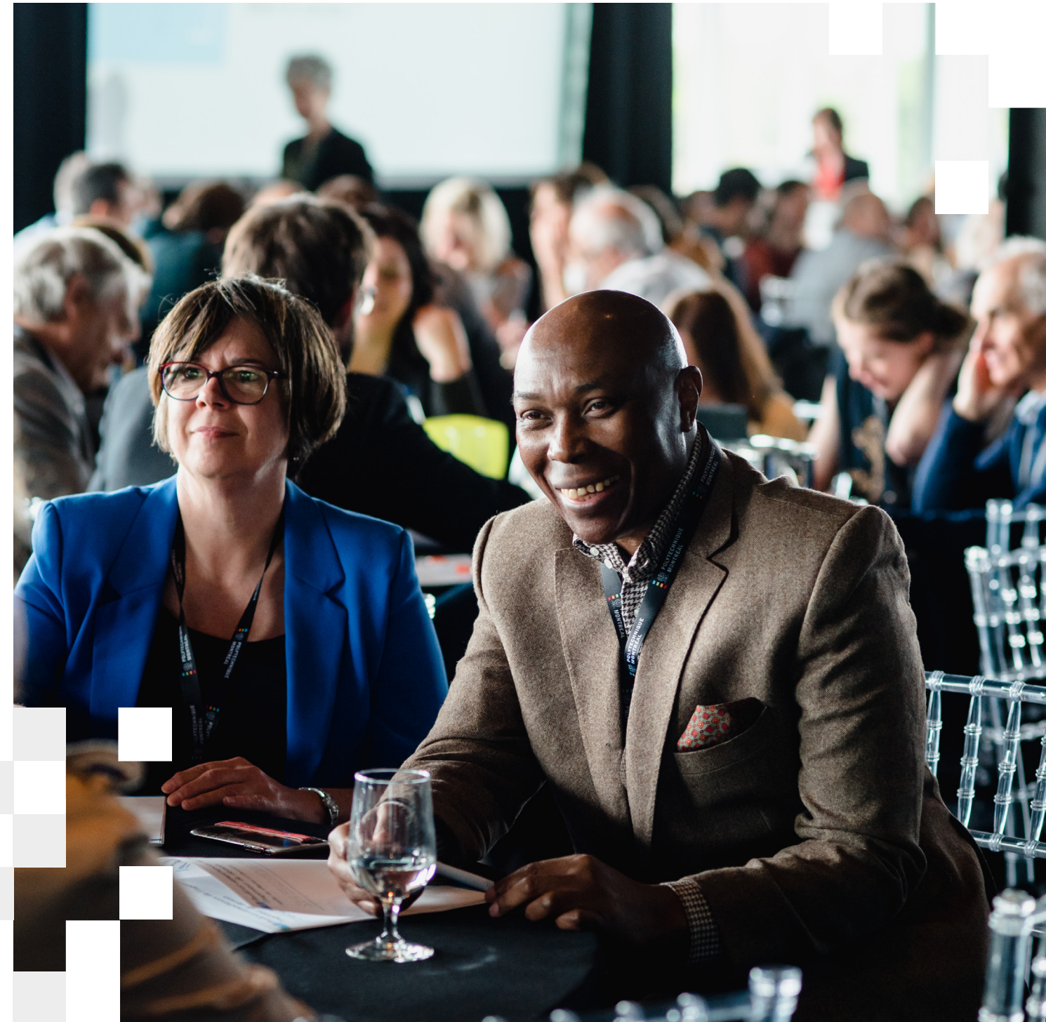
Forum sur l'ingénieure et l'ingénieur de demain - mai 2023

répondants à un sondage envoyé à l'ensemble de la communauté