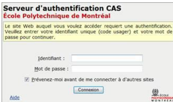
Figure 3 - Authentification CAS

Veuillez cliquer sur le bouton ( Authentification ) (Figure 1) dans le coin supérieur droit de l'interface d'accueil de Sympa. La page Web d'authentification (Figure 3) s'affichera :